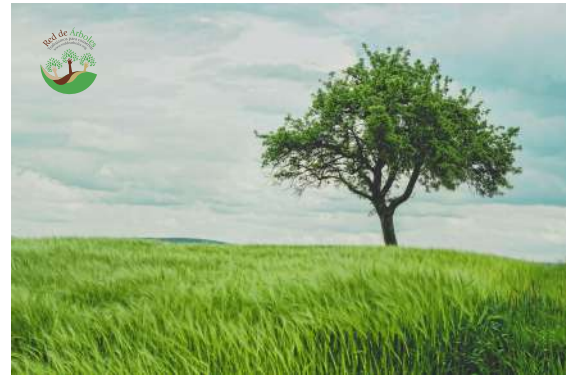
EN SU VERSIÓN A COLOR PARA FONDOS CLAROS

El logo debe ser usado únicamente en sus tres versiones, según corresponda el fondo en el que sea dispuesto.