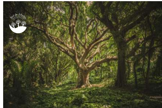
EN SU VERSIÓN EN NEGATIVO PARA FONDOS OSCUROS EN DONDE SE PUEDA PERDER